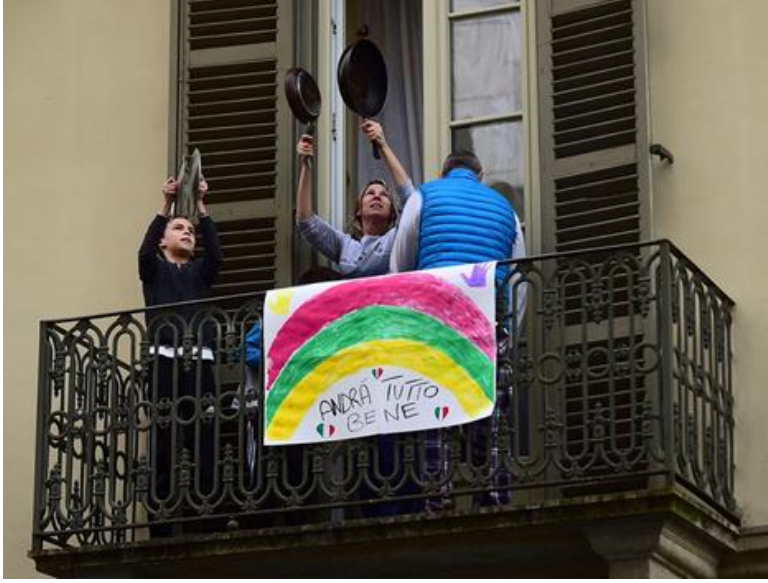
Resim-1: İtalya’da Balkonda Müzik Yapan Ev Halkı

Dijitalleştirilmiş müzeler (British Museum-Londra, The Metropolitan Museum of Art-New York, Pergamonmuseum-Berlin ve Rijksmuseum-Amsterdam, Türkiye’de Pera Müzesi, Sakıp Sabancı Müzesi, İstanbul Modern, Borusan Contemporary, Masumiyet Müzesi, İstanbul Araştırmaları Enstitüsü, SALT, Rezan Has Müzesi, Elgiz Müzesi ve Sadberk Hanım Müzesi), arşivlenmiş bale, opera, tiyatro gibi sahne sanatlarının televizyonlarda gösterime sunulması, pandemi döneminde önemli etkinliklerdir.