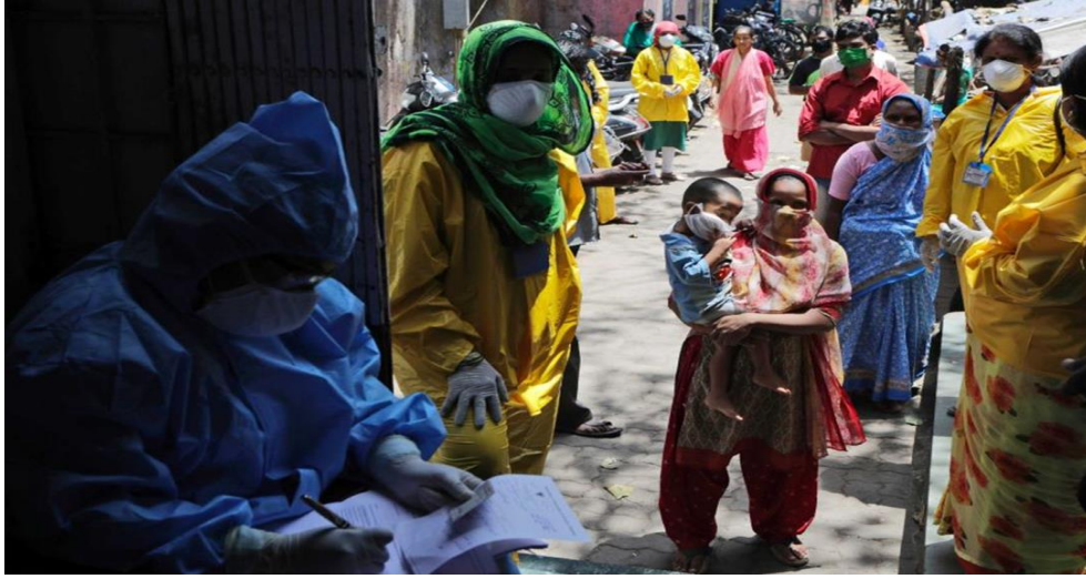
Resim-4: Fotoğraf ve Covid-19