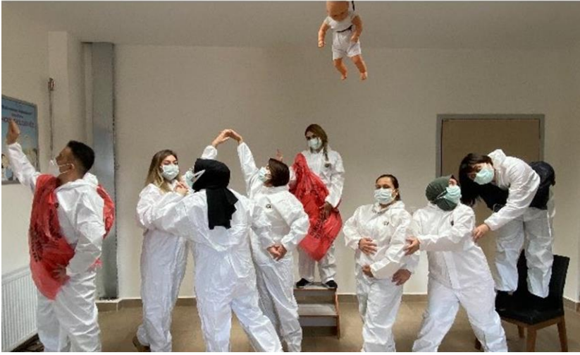
Resim-2: Osmançık İlçe Sağlık Müdürlüğü Filyasyon Ekibinin Covid-19 Bağlamında Bir Performansı