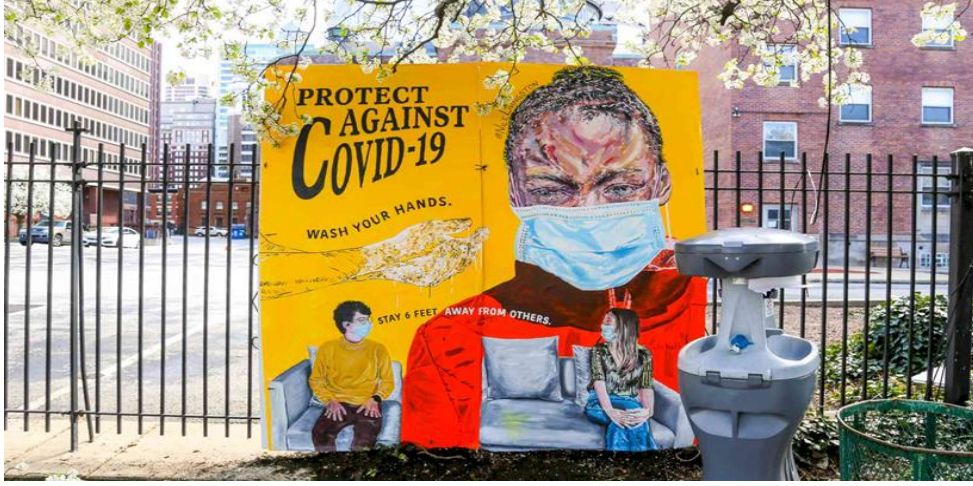
Resim-3: Resim Yoluyla Covid-19 Mücadelesi